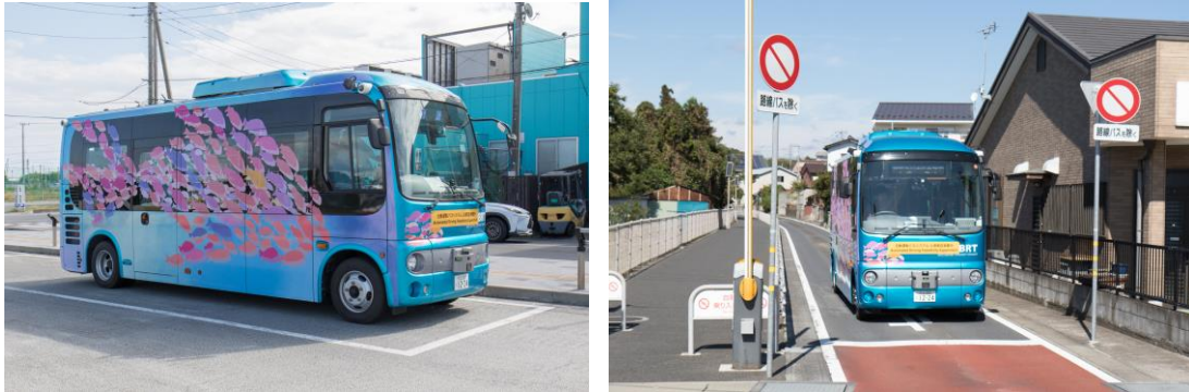
実証実験で使用した自動運転バス車両／自動運転バスの走行風景